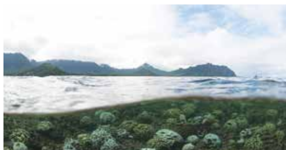
Blanqueamiento en la Bahía Kaneohe en Hawaii

Los corales, el plancton y los crustáceos usan iones de calcio ( \text{Ca}^{2+} ) e iones de carbonato ( \text{CO}_3^{2-} ) para construir sus esqueletos y conchas de carbonato de calcio, un proceso conocido como calcificación. La ecuación 4 muestra la reacción de precipitación de iones de calcio y carbonato de hidrógeno, que reaccionan en el océano para formar carbonato de calcio. A medida que aumenta la acidez del océano, la concentración de \text{H}^+ aumenta, hay menos \text{HCO}_3^- y más \text{CO}_2(\text{ac}) disponibles (ver ecuación 2), y este equilibrio se desplaza hacia la izquierda. Las especies menores de carbonato (en la ecuación 3) también puede reaccionar con el ion de calcio para formar carbonato de calcio, pero a la vez, hay relativamente menos de éste con el aumento del \text{H}^+ . Por lo tanto, es más difícil que se forme el carbonato de calcio, lo que significa que las conchas no pueden formarse tan fácilmente