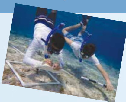
Estudiantes investigando y documentando los arrecifes de coral.

Estos estudiantes tienen mucho en qué pensar cuando regresen de Costa Rica. En el transcurso de dos semanas, han aprendido cómo los océanos interactúan con el clima en general y cómo las actividades humanas pueden afectar la vida oceánica.