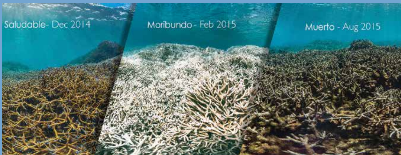
Coral en Samoa Americana antes, durante, y después de un evento de blanqueamiento de corales.

La pérdida de los hábitats de los arrecifes y el daño a las especies, ya sea directamente o a través de interrupciones en la cadena alimentaria, también podrían afectar a las poblaciones humanas. En muchas áreas del mundo, los arrecifes de coral bloquean y desvían parte de la energía de las olas oceánicas, lo que significa que el agua entre la orilla y el arrecife es más tranquila de lo que sería de otra manera. Si las estructuras de coral se debilitan, podrían verse dañadas por las tormentas, lo que reduciría drásticamente este efecto calmante. Además, la pérdida de hábitat para el 25% de las especies oceánicas que llaman hogar a los arrecifes de coral podría tener grandes repercusiones.